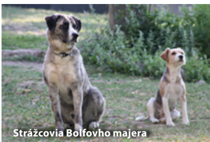
Strážcovia Bolfovho majera

„Mapujeme hlavne okolie pohoria Vtáčnik a snažíme sa sprevádzkovať oficiálne jazdecké trasy, ktoré sa v okolí doteraz nenachádzali,“ hovorí. Snažia sa spoločne aj s novovzniknutými jazdeckými stanicami a ich členmi o to, aby jednotlivé trasy mohli byť oficiálne vyznačené v teréne, ale aj na mapách. Minulý rok mapovali Ponitrie, okruh Vtáčnika, Kremnické a Štiavnické vrchy. Cez zimu by chceli administratívne v spolupráci so sekciou značenia KST poschvaľovať jednotlivé jazdecké trasy, aby im boli pridelené evidenčné čísla, a na jar začať so značením v teréne.